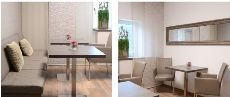
Aufenthaltsraum für alle Angehörigen.