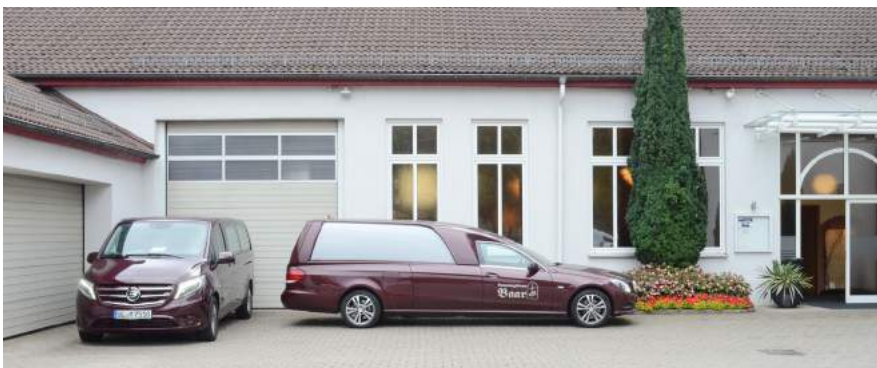
Unser moderner Fuhrpark